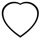
Point de vie COR+ROB+10