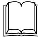
Lancer de sort ESP+AUR+BM-VA