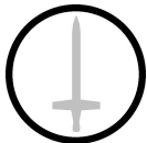
Attaque de mêlée COR+FOR+BA