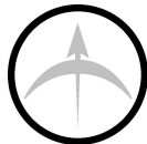
Attaque à distance AGI+DEX+BA